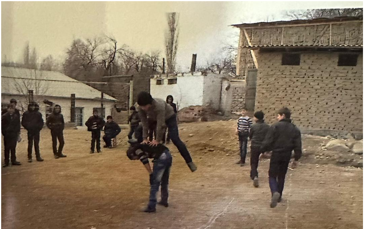
Расми 3.15. Бозии адмирно