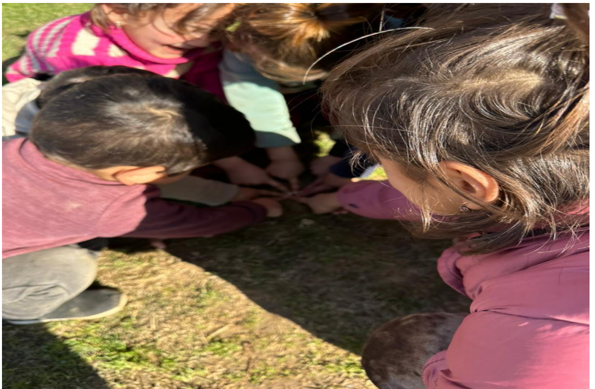
Расми 3.4. Бозиҳои атфол: тути тал