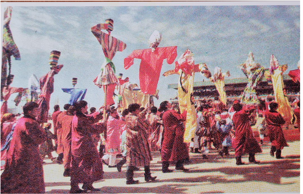
Расми 1.3. Ашаглон