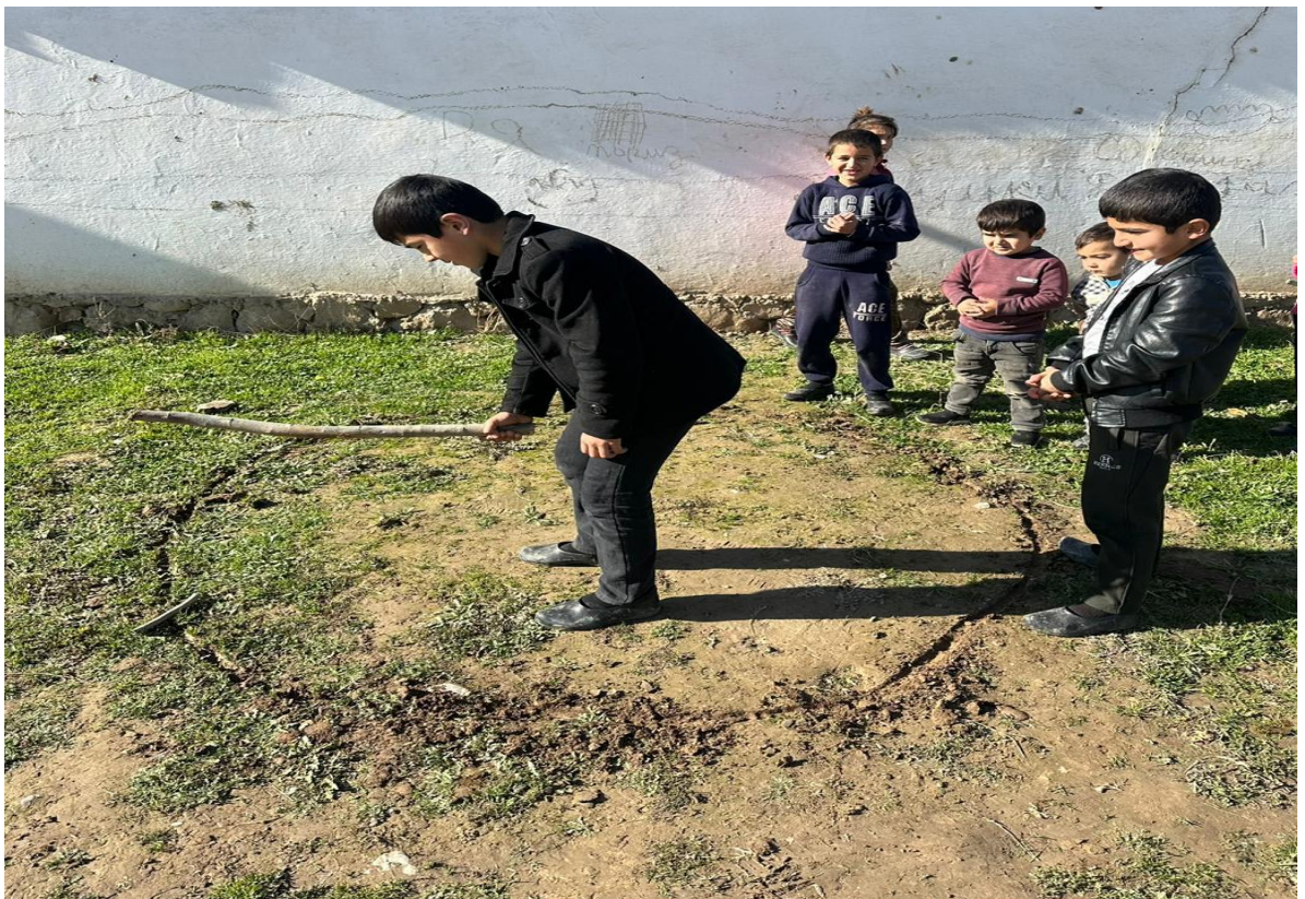
Расми 3.14. Чиликдангал дар байни кӯдакон