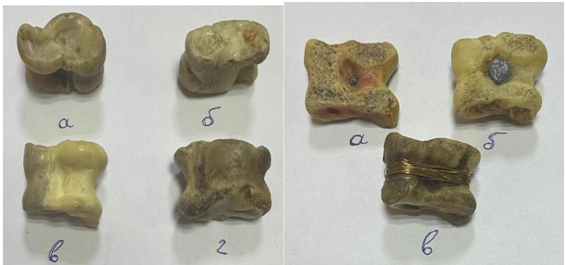
Расми 3.1. Паҳлуҳои бучул: Расми 3.2. Сақаҳо: а,б. барои бозии а. «асп», б. «хар», в. чук, г. пук бологузarak, в. барои бозии гулҷӣ