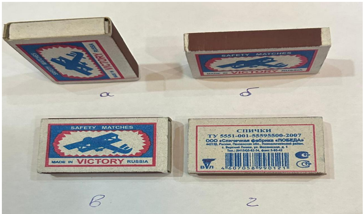
Расми 3.10. Асбоби бозӣ (куттии гӯгирд) барои «Подшоҳбозӣ». Пахлуҳои «асбоб»: а. «Подшоҳ», б. «Вазир», в. «Халифа», г. «Дузд»