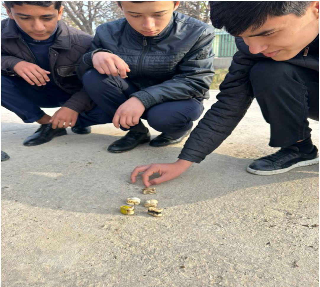
Расми 3.8. Бучулбозӣ (нахшак)