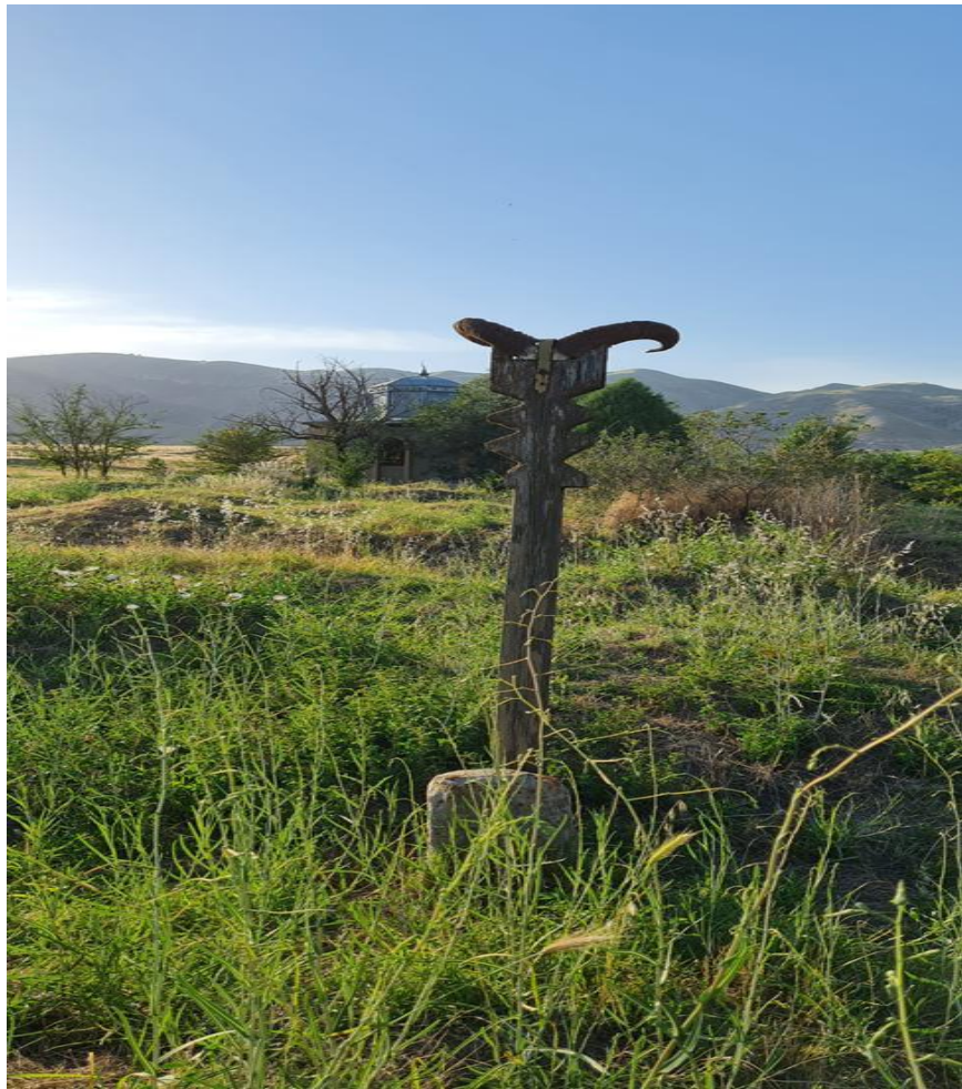
Расми 2.3. Нишонаи болои қабр, деҳаи Пушинг, давраи шуравӣ