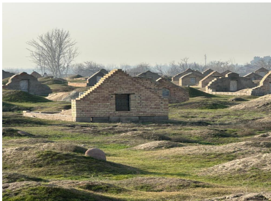
Расми 2.4. Қабристон дар деҳаи Навободи ноҳияи Абдурахмони Ҷомӣ