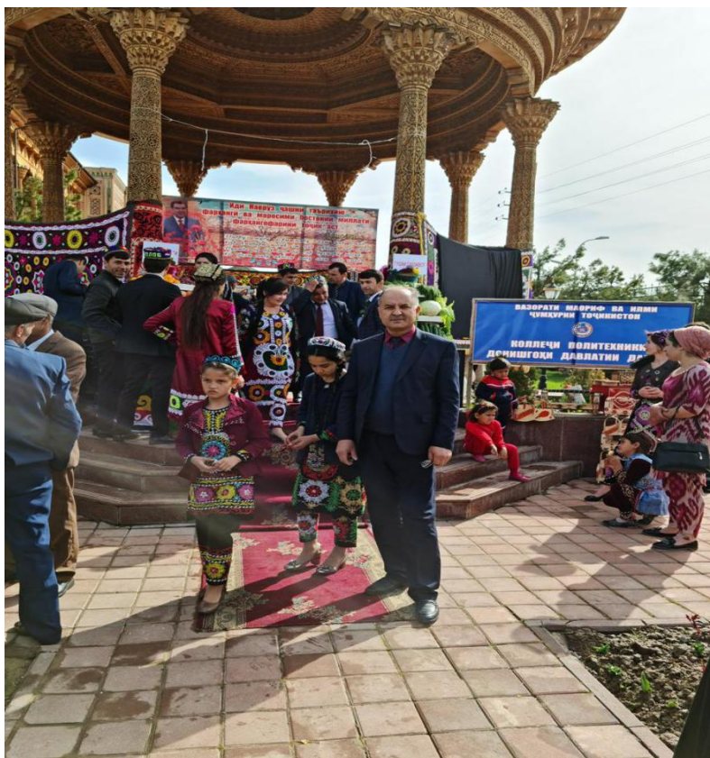
Расми 1.8. Чашни Наврӯз дар давраи соҳибистиклолӣ