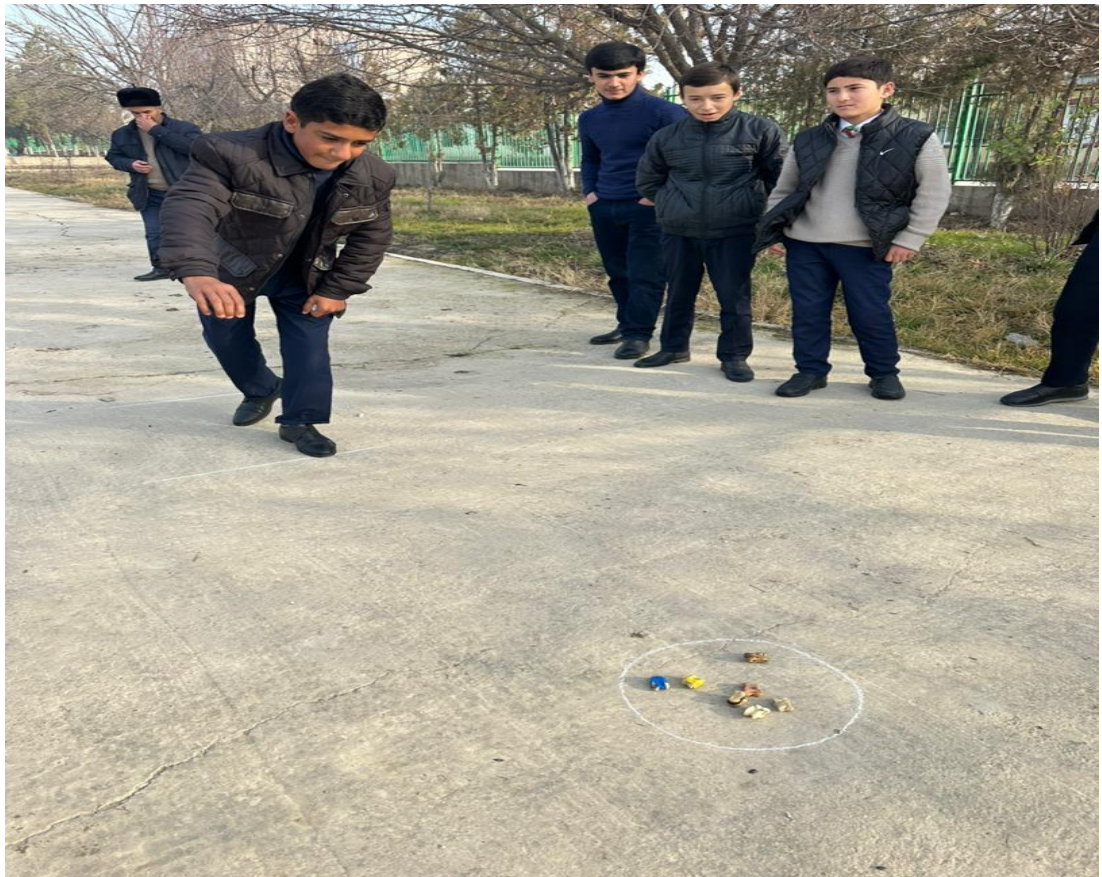
Расми 3.9. Буҷулбозӣ (гулҷӣ)