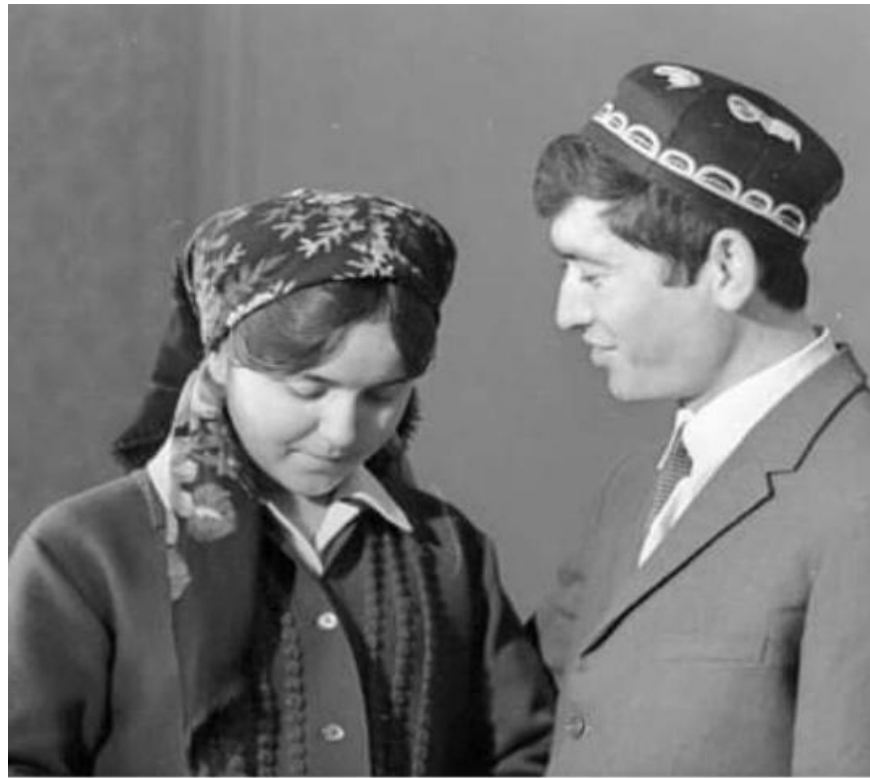
Расми 2.1. Интихоби ҳамсар