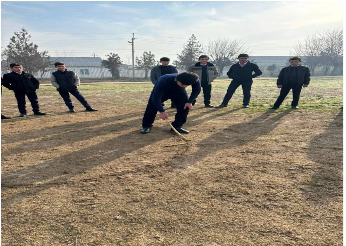
Расми 3.13. Чиликдангал