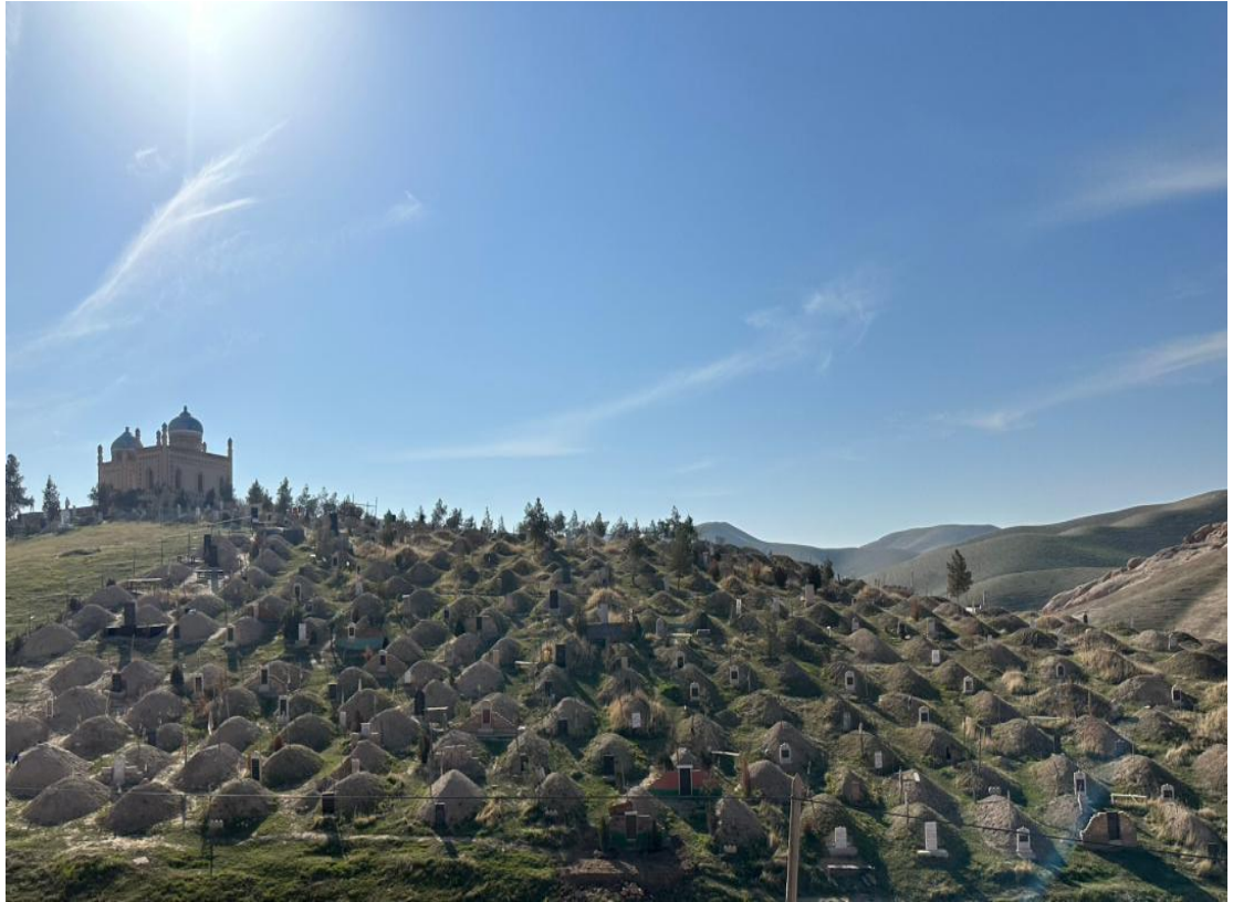
Расми 2.5. Намуди умумии мазори Шайх Абдусалом (давраи соҳибистиклолӣ, барои муқоиса)