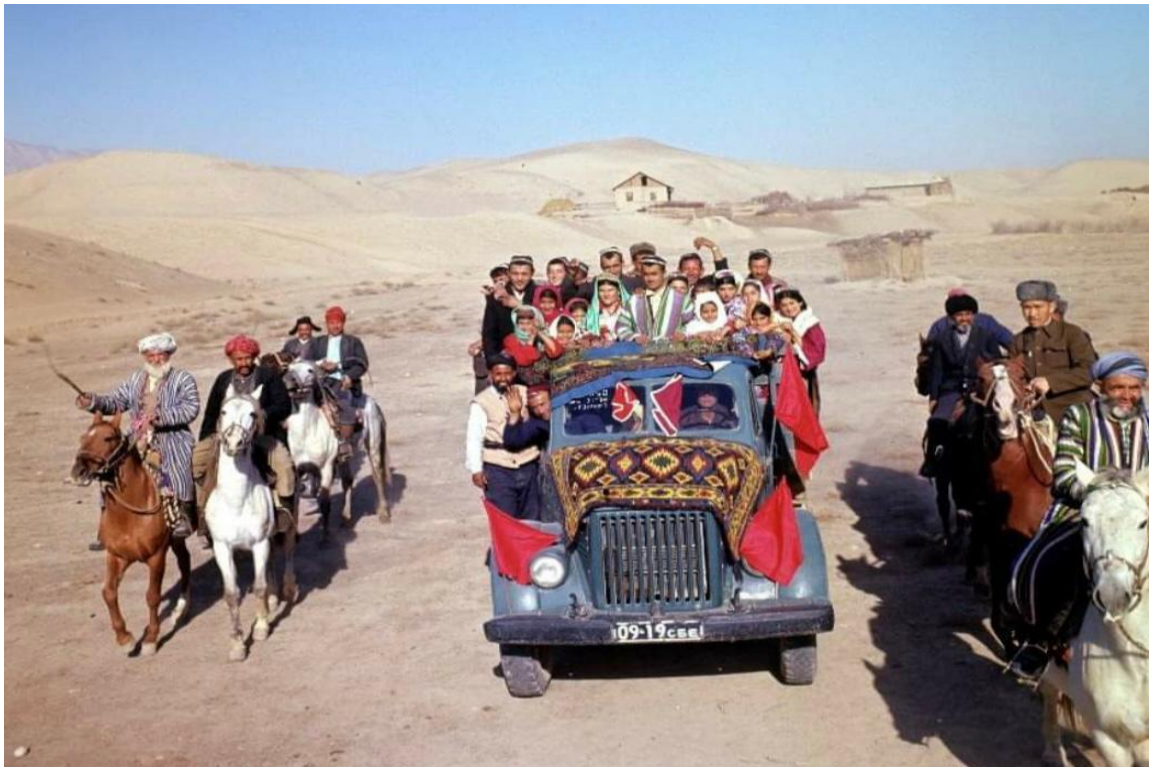
Расми 2.2. Тӯйи арӯсу домодӣ дар минтақаи Кӯлоб. Овардани арӯс ба хонаи домод (солҳои 60-уми асри XX)