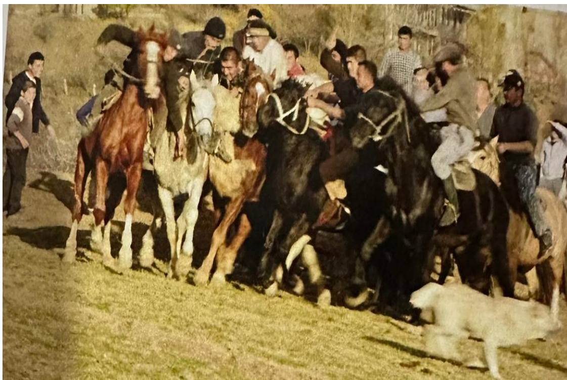
Расми 1.9. Бозиҳои варзиши наврӯзӣ. Бузқашӣ