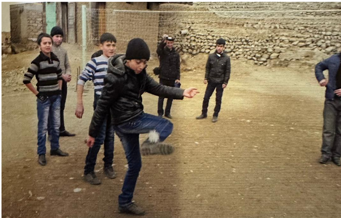
Расми 3.11. Ланкабозӣ