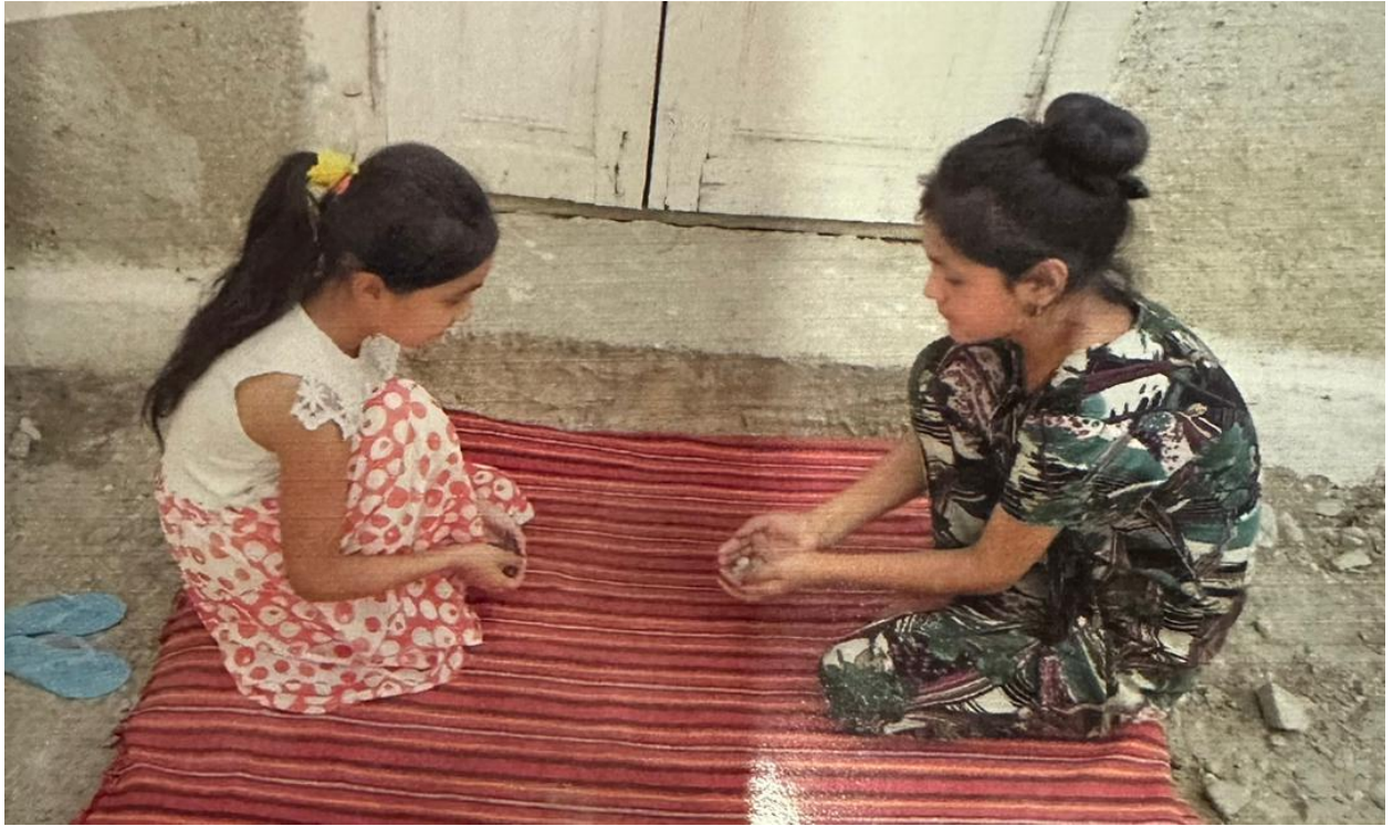
Расми 3.3. Бозиҳои наврӯзӣ. Сангчилбозӣ