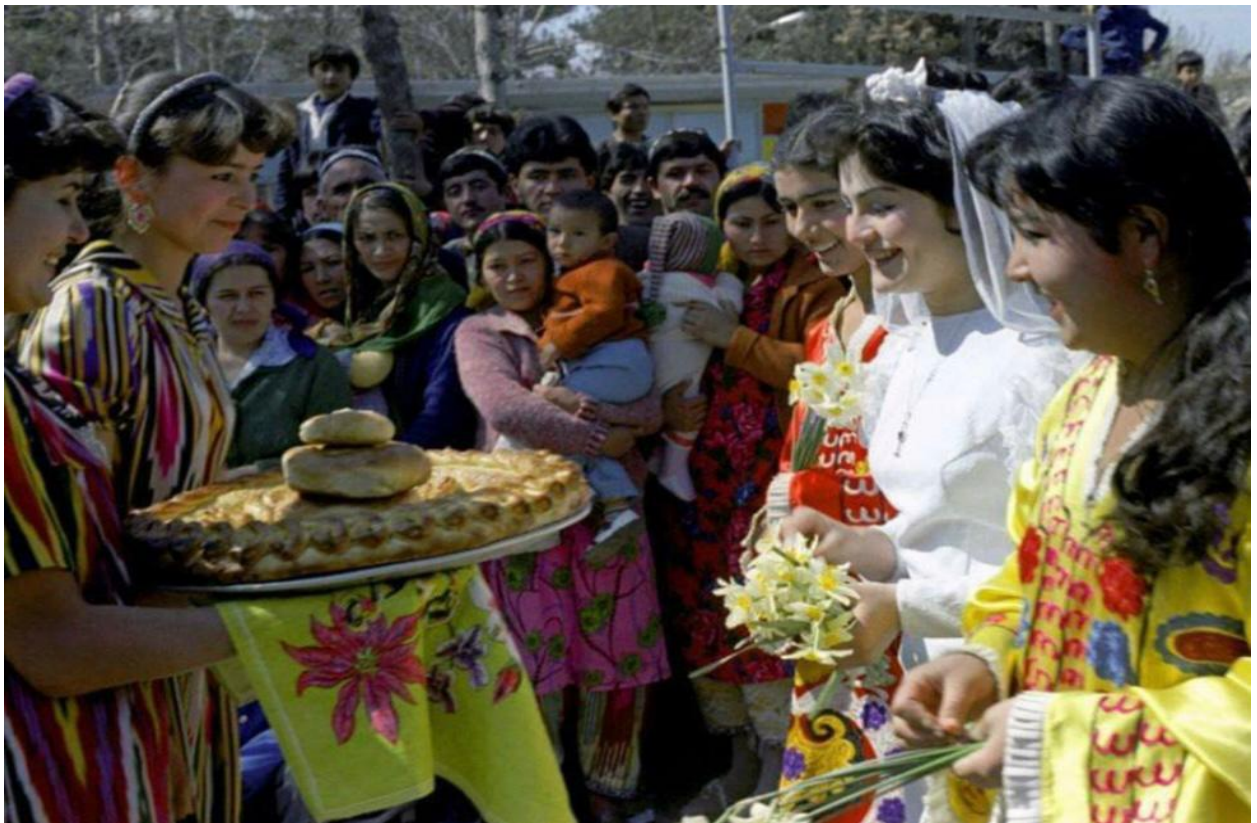
Расми 1.7. Чашни Наврӯз дар солҳои 80 - уми садаи XX