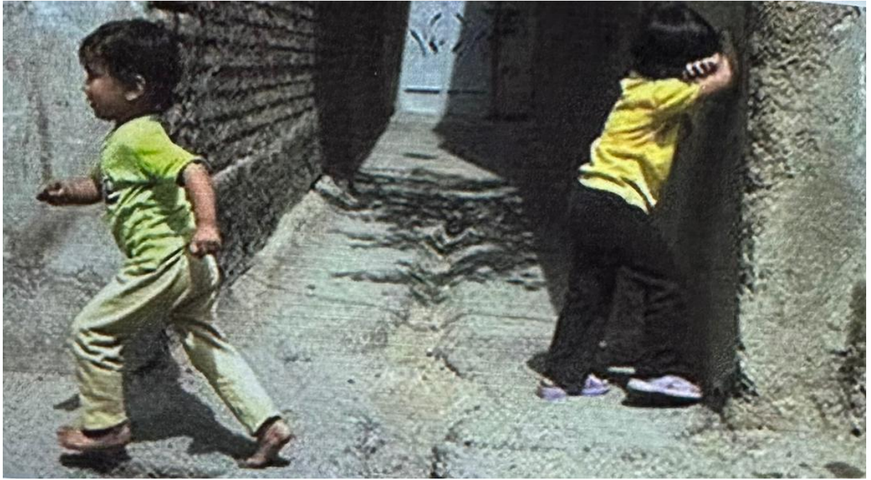
Расми 3.5. Бозиҳои атфол: Рустшавакон