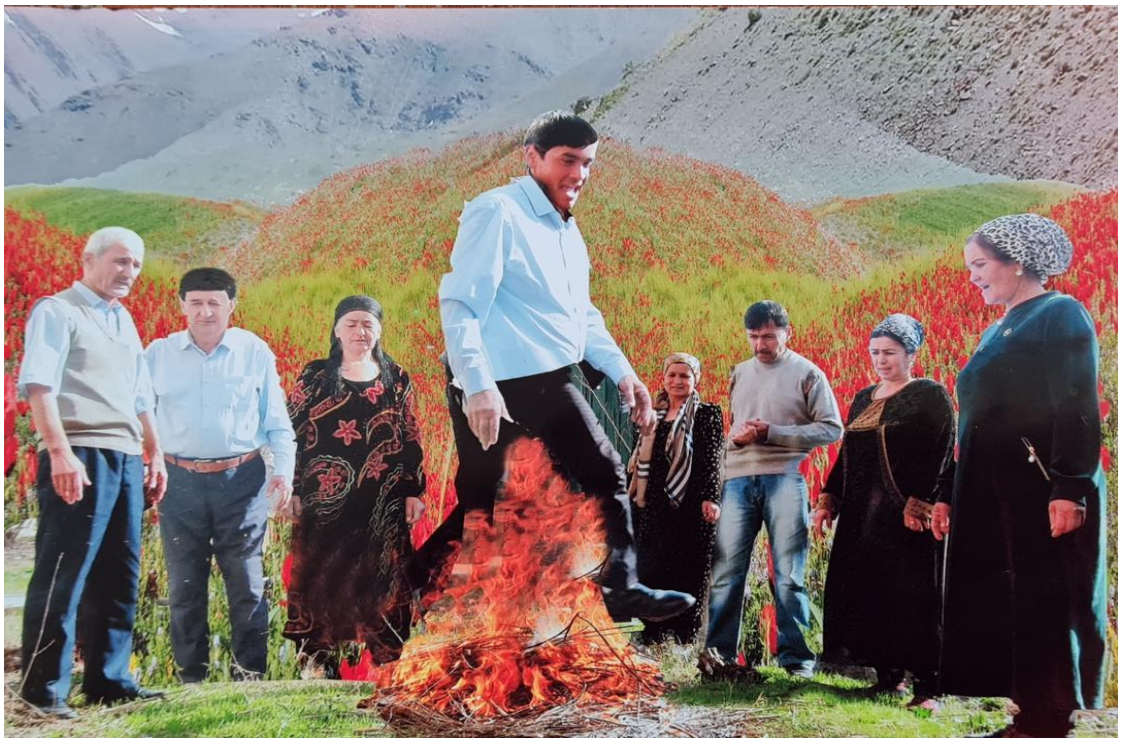
Расми 1.2. Чаҳидан аз боли гулхан дар чашнҳои Наврӯз ва Сада (давраи соҳибистиклолӣ)