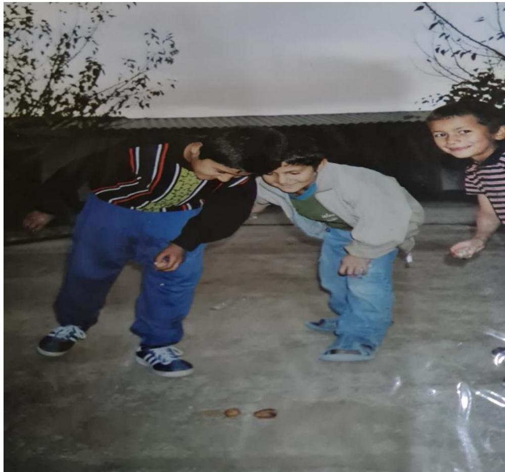
Расми 3.6. Буҷулбозӣ