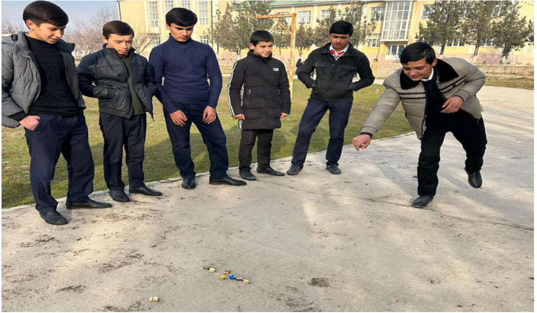
Расми 3.7. Бучулбозӣ (бологузарак)