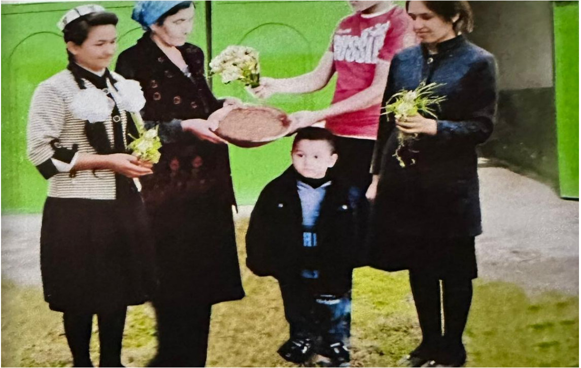
Расми 1.1. Маросими гулгардонӣ бо фарорасии Наврӯз