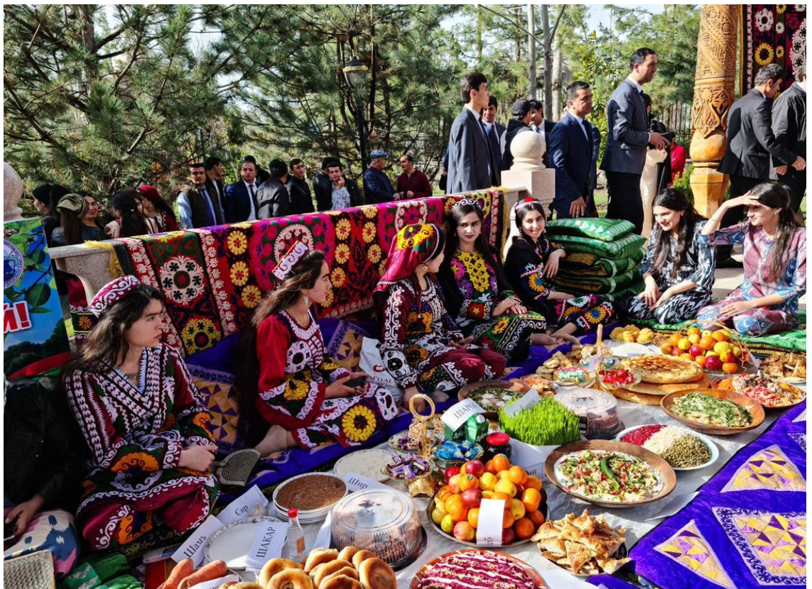
Расми 1.5. Хони наврӯзӣ (давраи соҳибистиклолӣ)